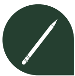
Crayon à papier