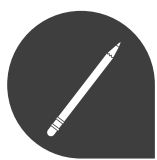
Crayon à papier